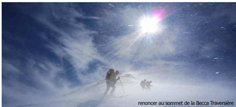
renoncer au sommet de la Becca Traversière