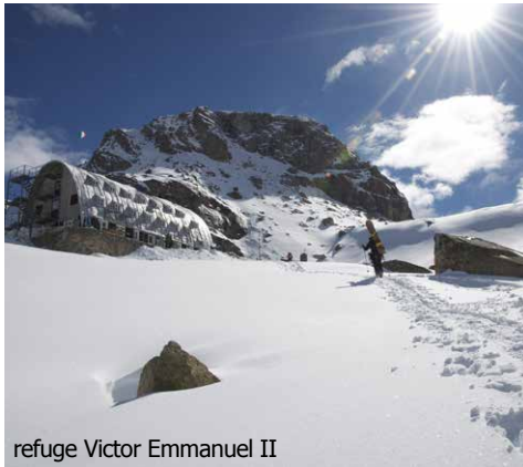
refuge Victor Emmanuel II