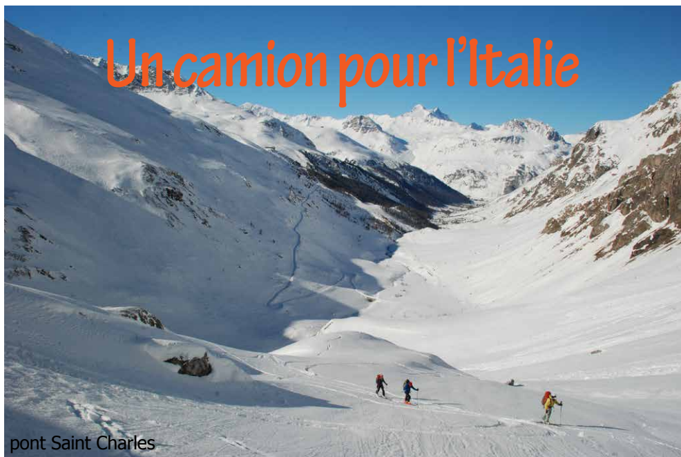
pont Saint Charles

N euftêtes qui dépassent à travers les vitres graffitées aux valeurs du CAF, neuf passagers, pas clandestins mais bien triés sur le volet, en route pour un périple qui, on leur a dit, promet de ménager leurs corps défraîchis de Tamalous, à de rares exceptions près !