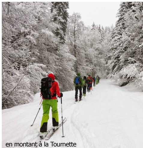
en montant à la Tournette