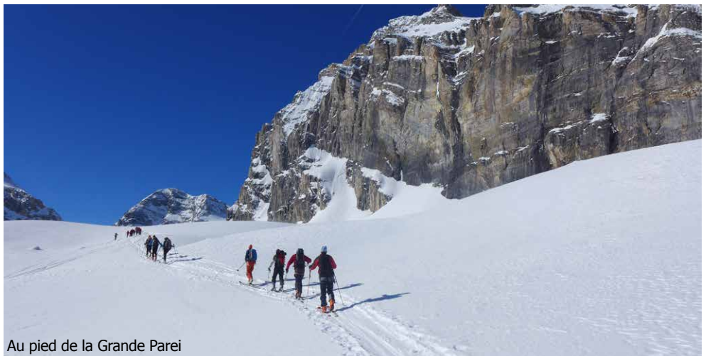
Au pied de la Grande Parei