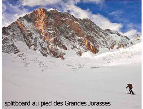
splitboard au pied des Grandes Jorasses