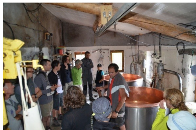
Weekend pastoralisme / CAF Chambéry