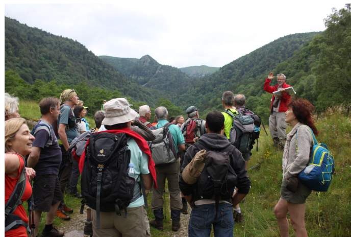
Randonnée dans une ancienne vallée glaciaire / CD 68