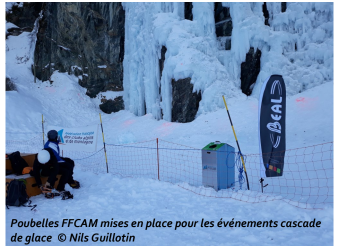
Poubelles FFCAM mises en place pour les événements cascade de glace

Cependant, le cahier des charges peut repousser les organisateurs en raison de la charge de travail supplémentaire que cela pourrait impliquer de leur part ; néanmoins, il faut plutôt le voir comme une feuille de route à suivre