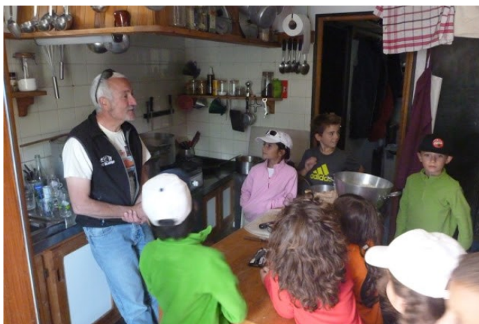
Weekend en refuge / Croc'Montagne