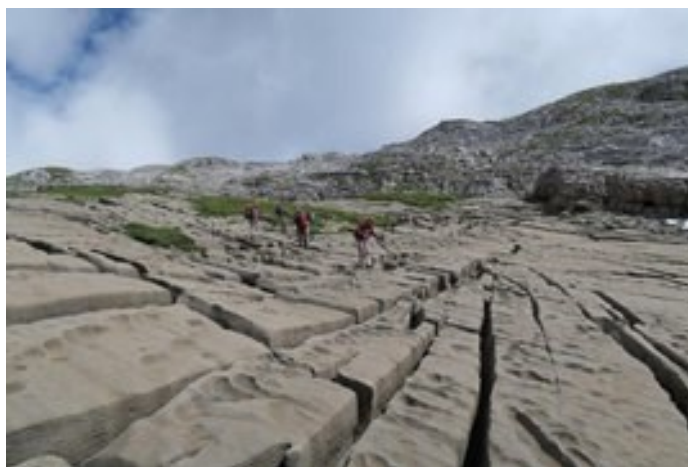
Randonnée géologique / CAF Bassin clusien