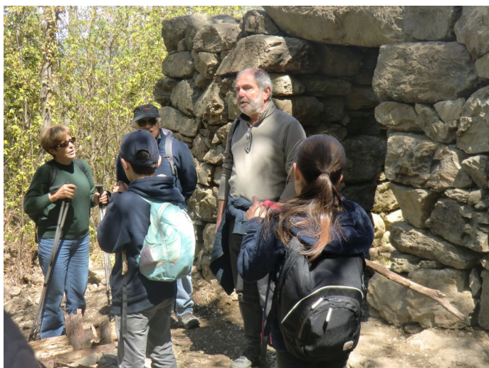
Randonnée patrimoine / CD 66